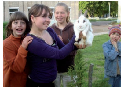
Een van de zojuist gekochte konijnen

In 2008 werd gestart met de bouw van de Mini-leerboerderij. Rotary Oisterwijk heeft een grote bijdrage geleverd aan de verwezenlijking ervan. Zij zochten en vonden sponsors zoals Stichting Familie Ommering, die de grootste bijdrage leverde. Wilde Ganzen en NCDO besloten tot het verlenen van premies en een subsidie. Er werden stalletjes gebouwd, omheiningen geplaatst en licht aangelegd. Er werd met de brandweer overlegd en hard gewerkt aan voorwaarden om jonge kinderen veilig te kunnen leren een verscheidenheid aan dieren te verzorgen. De kinderen zijn enthousiast en maken met plezier de stallen schoon. Er wordt gehooit, met water gesleept en gespeeld met de dieren. Ook de allerkleinsten hebben