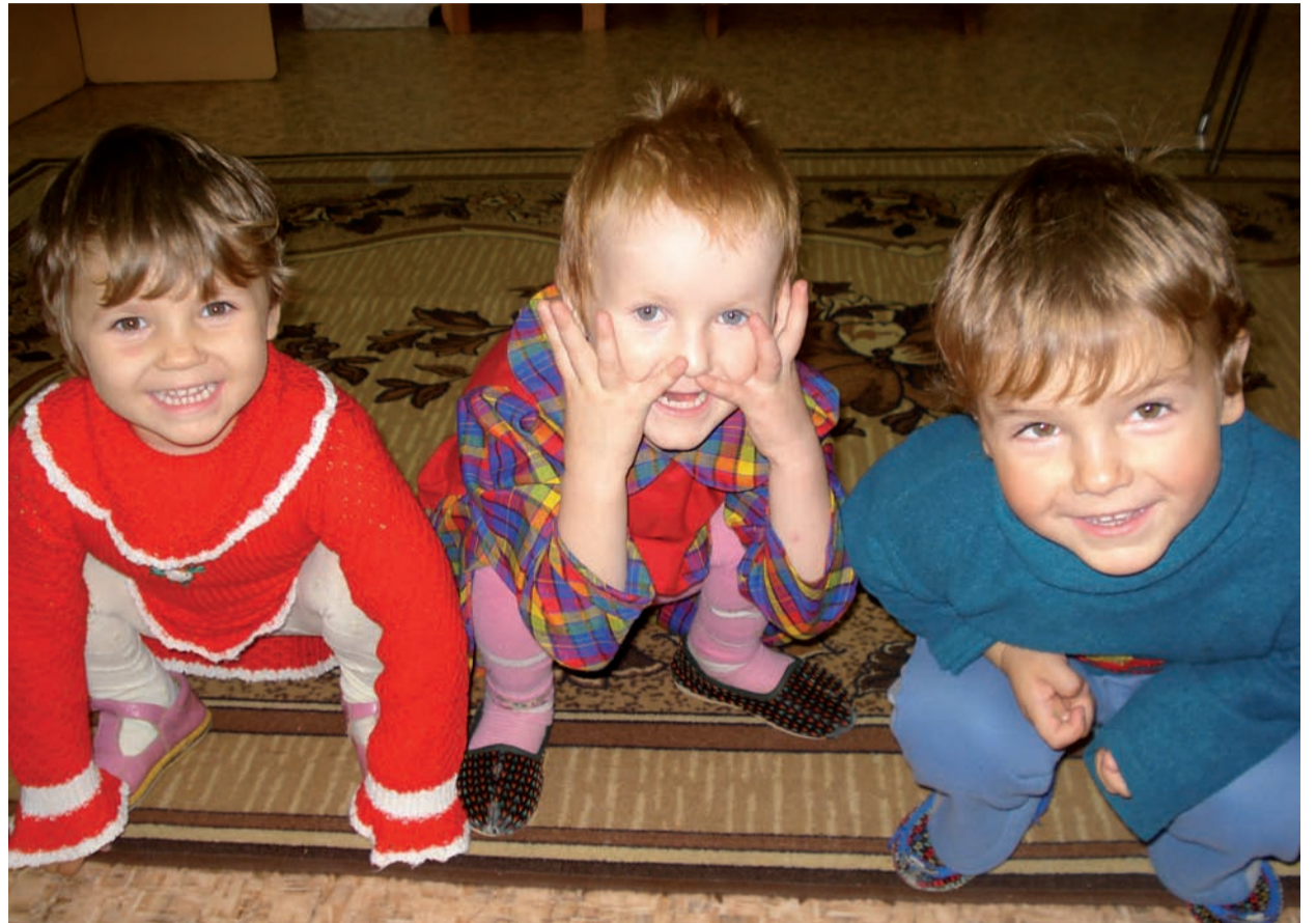
Kinderen uit de crisisopvang worden liefdevol opgevangen