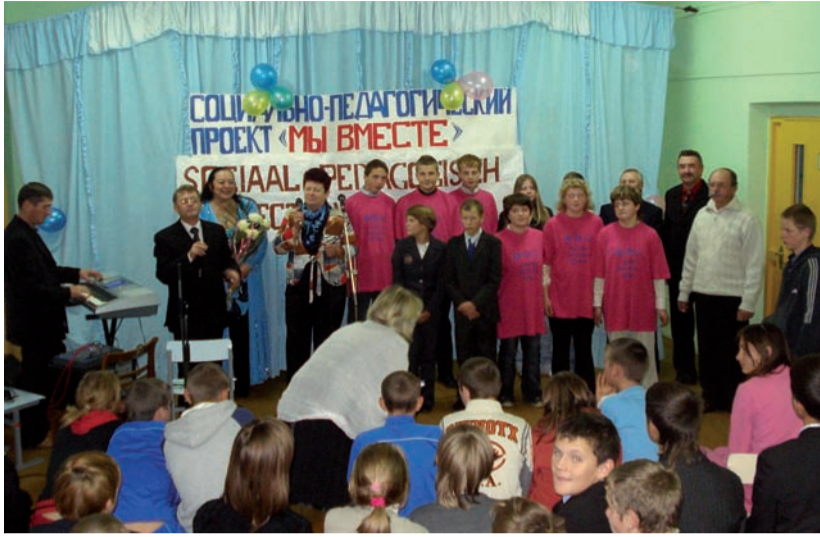
Introductie van het project zelfstandig wonen in een tweede internaat Stolptsj. Op het spanndoek staat geschreven: Sociaal pedagogisch project "WIJ SAMEN".

In het Kopyl schoolinternaat worden kinderen met een verstandelijke beperking verzorgd en onderwezen. De problemen wat betreft de hulp aan deze kinderen bij de voorbereiding naar zelfstandig zijn niet alleen inherent aan hun psychische ontwikkeling, maar ook aan het verkrijgen van vaardigheden. Het leren aanschaffen van kleding en schoenen, schoonhouden van de leefruimte, klaarmaken van voedsel, kweken van groenten en zorgen voor vee is absoluut nodig om succesvol zelfstandig te kunnen wonen. Daarom geeft dit schoolinternaat bijzondere aandacht aan het onderwijzen van deze vaardigheden en schept voorwaarden om zelfstandig wonen voor verstandelijke beperkte jongeren mogelijk te maken. Dit is alles is mogelijk door de hulp van Stichting Weeshuizen Belarus. Zij gaf ons de mogelijkheid om kinderen deze vaardigheden in de praktijk te kunnen onderwijzen. Er werd tevens een zorgboerderij gebouwd met stallen, opslagschuren en meerdere belangrijke projecten werden uitgevoerd. Dank zij deze hulp kon het succesvolle Agro-Socio-Project worden gerealiseerd.