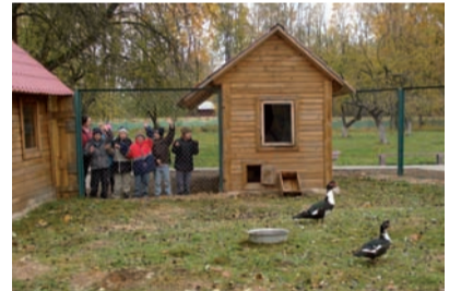
Verschillende soorten eenden

daarin hun taak. Deze kinderen met een verstandelijk beperking hebben niet alleen plezier! Zij ontwikkelen zich lichamelijk maar ook psychisch beter. Kinderen tonen meer begrip voor elkaar, zijn vrolijker en doen hun uiterste best om te leren. Ongelofelijk wat deze Mini-boerderij teweeg heeft gebracht. Voor deze leerboerderij is gekozen om de overgang naar de praktijkboerderij van de professionele opleiding makkelijker te maken. Nu kan daar zelfs het lesprogramma worden uitgebreid omdat de basiskennis al aanwezig is. De Mini-leerboerderij is klaar! Het project is door inzet van velen een succes geworden met een fantastisch resultaat. Het bestuur dankt Rotary Oisterwijk en haar sponsors voor hun inzet en medewerking.